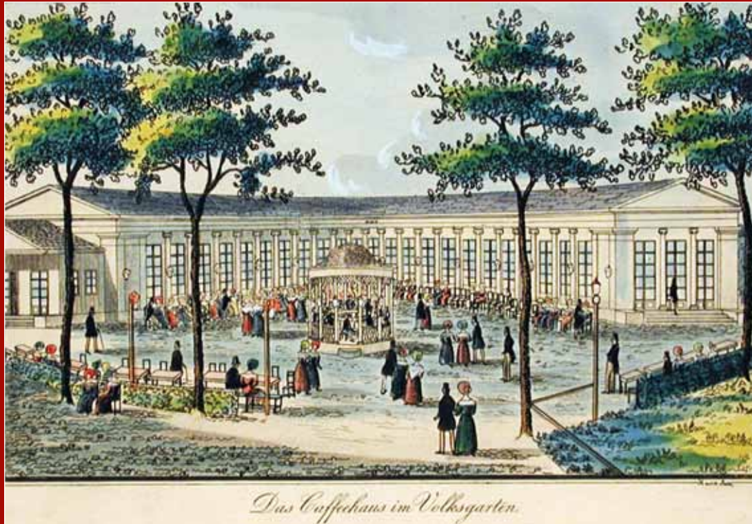
Das Caffeehaus im Volksgarten.