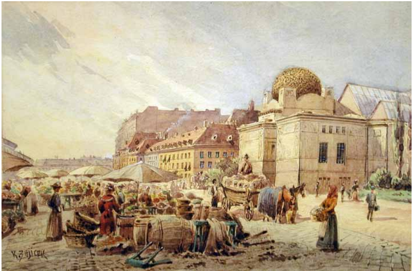
Carl Wenzel Zajicek Wien 1860 – 1923 Wien Naschmarkt vor der Secession Aquarell auf Papier signiert 10,5 x 15,8 cm