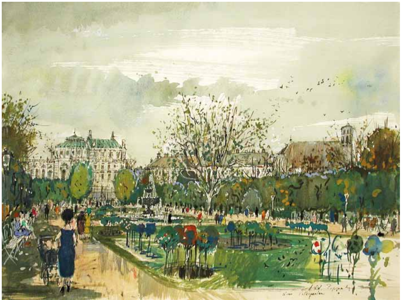
Hans Robert Pippal Wien 1915 – 1998 Wien Spaziergang im Volksgarten Aquarell / Gouache auf Papier signiert und bezeichnet 35,7 x 48 cm