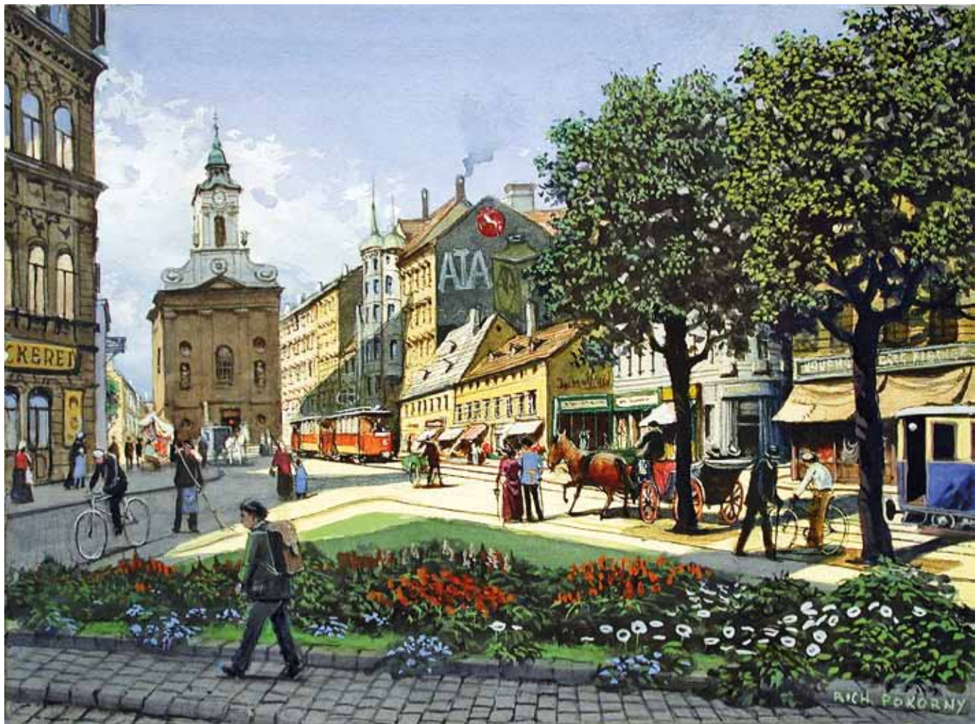
Richard Pokorny Wien 1907 – 1997 Wien Rauchfangkehrerkirche Aquarell / Gouache auf Papier signiert 24,5 x 34,5 cm