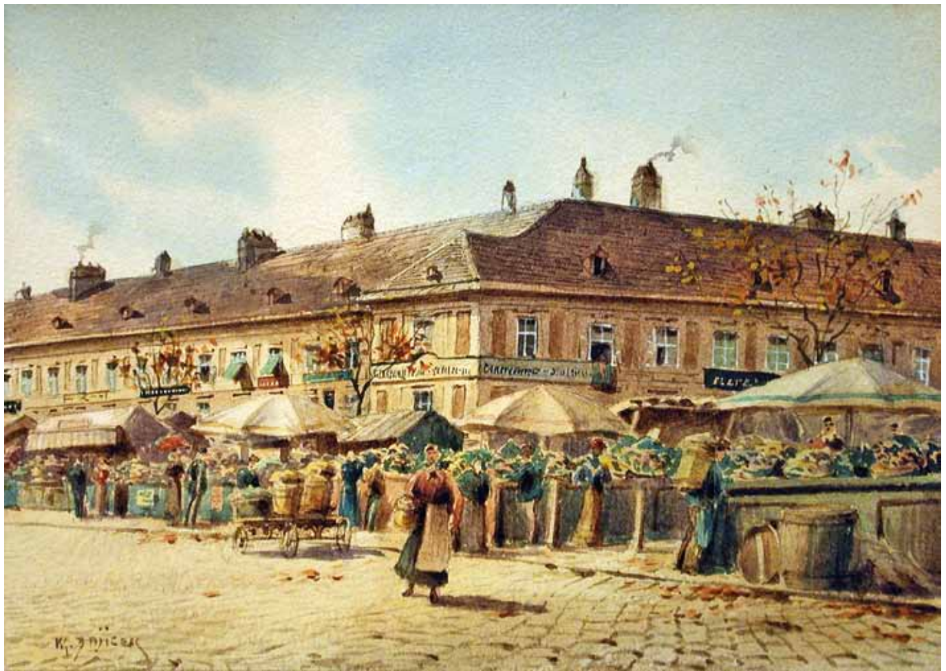
Carl Wenzel Zajicek Wien 1860 – 1923 Wien Marktreiben beim Freihaus Aquarell auf Papier signiert 10,5 x 14,5 cm