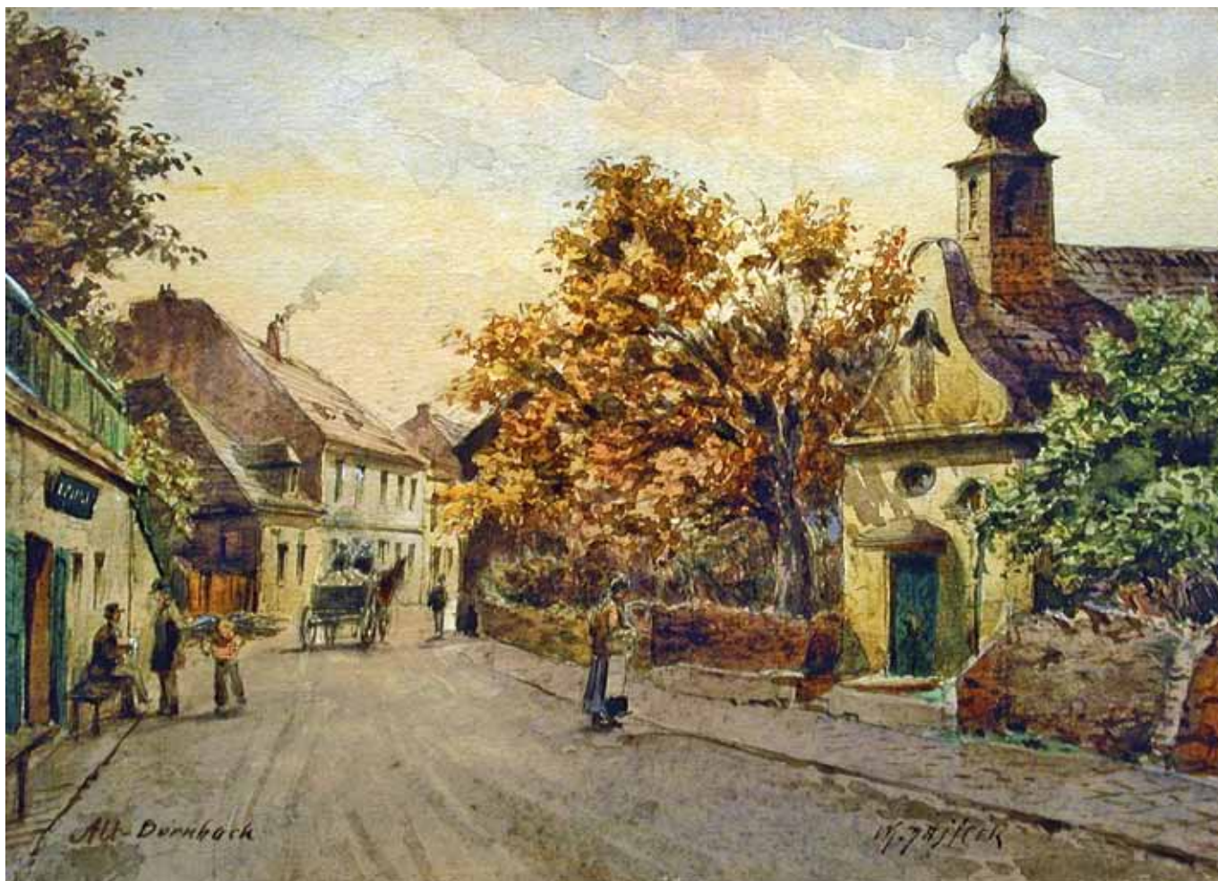
Carl Wenzel Zajicek Wien 1860 – 1923 Wien Die St. Anna-Kapelle in Dornbach Aquarell auf Papier signiert und bezeichnet 10,5 x 14,5 cm