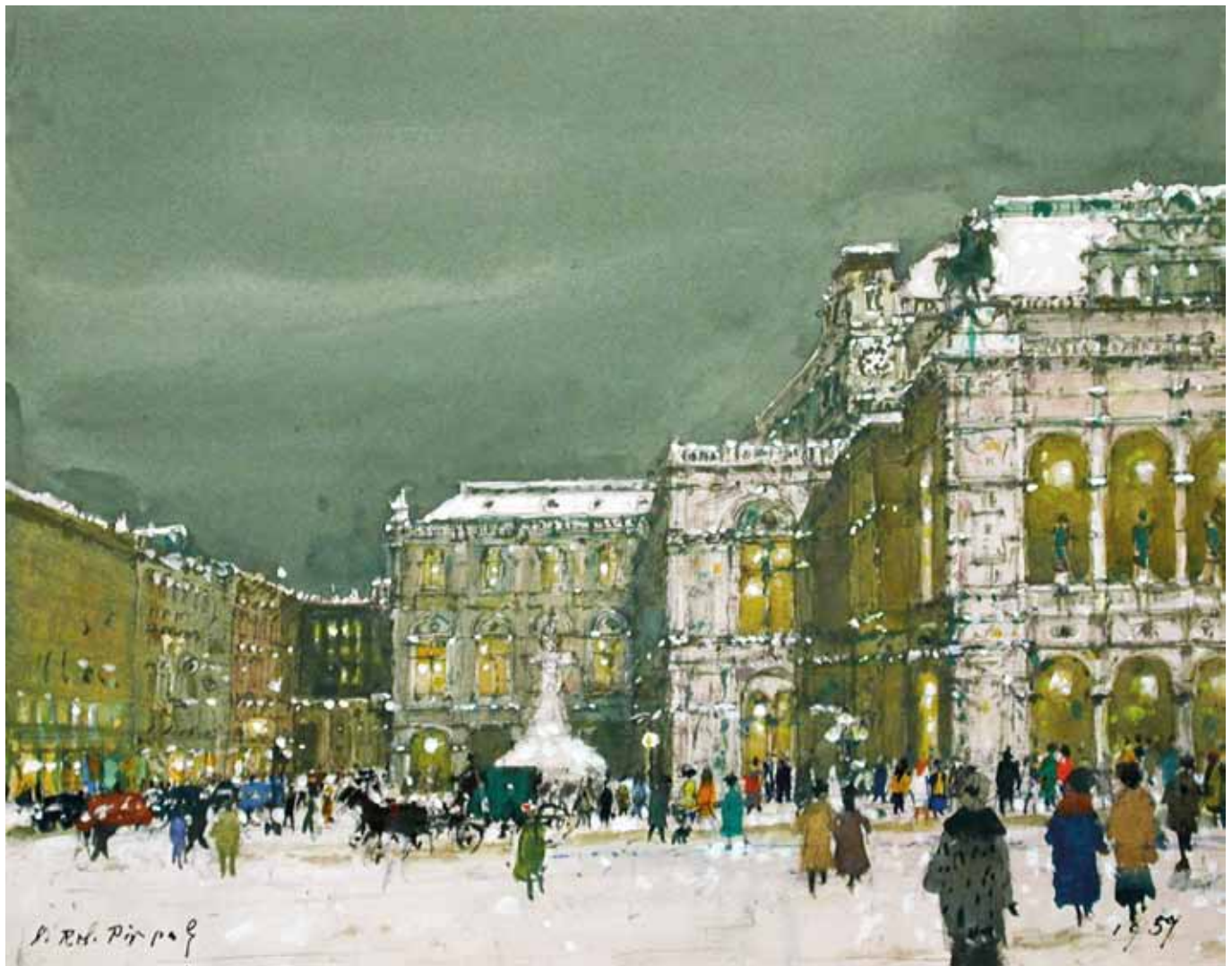
Hans Robert Pippal Wien 1915 – 1998 Wien Winterliche Oper Aquarell / Gouache auf Papier signiert und datiert 1959 32,2 x 40,6 cm