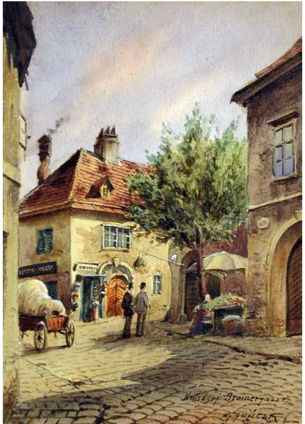
Carl Wenzel Zajicek Wien 1860 – 1923 Wien Nussdorf – Greinergasse Aquarell auf Papier signiert und bezeichnet 14,5 x 10,2 cm