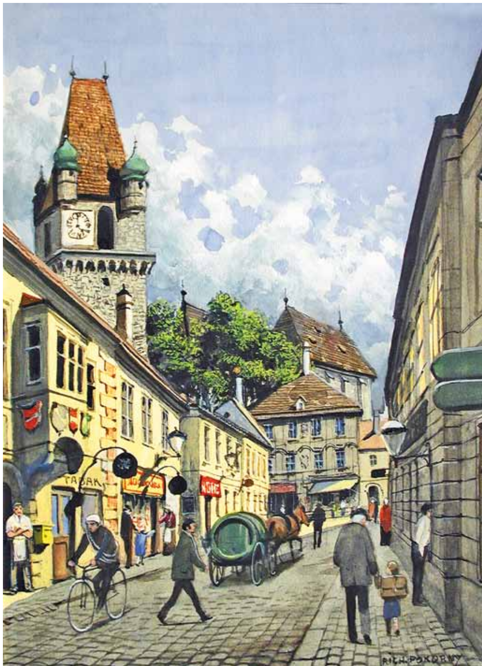
Richard Pokorny Wien 1907 – 1997 Wien Perchtoldsdorf Aquarell / Gouache auf Papier signiert 33,5 x 25 cm