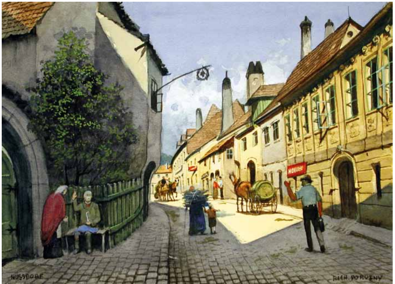
Richard Pokorny Wien 1907 – 1997 Wien Nussdorf Aquarell / Gouache auf Papier signiert und bezeichnet 24,5 x 34,5 cm