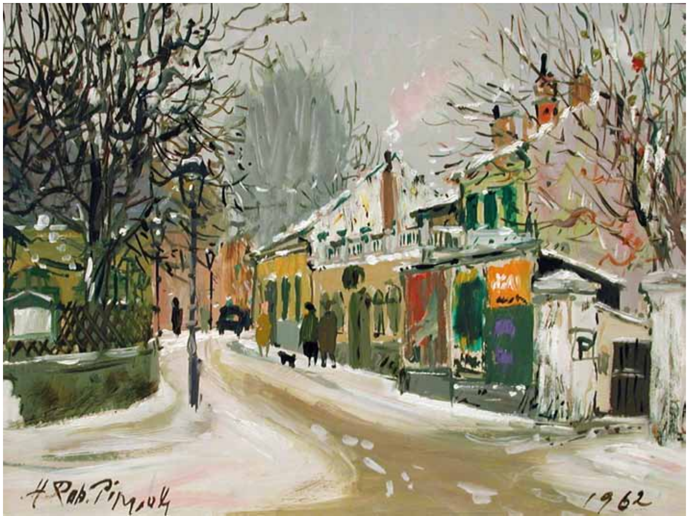
Hans Robert Pippal Wien 1915 – 1998 Wien Cobenzlgasse im Schnee (Wirtshaus Neuland) Öl auf Platte signiert und datiert 1962 WK HRP 422 24,5 x 31,8 cm