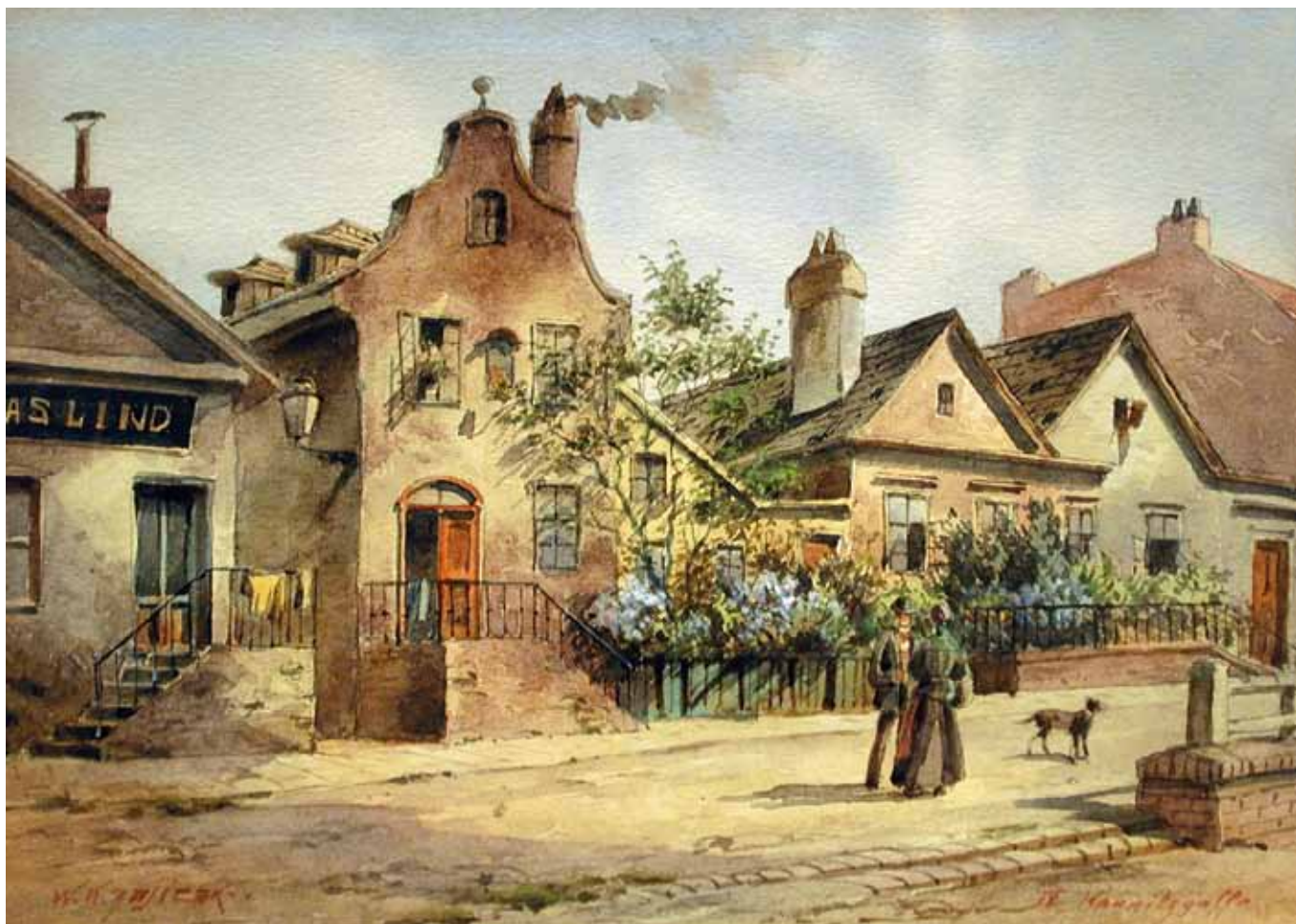
Carl Wenzel Zajicek Wien 1860 – 1923 Wien Kaunitzgasse Aquarell auf Papier signiert und bezeichnet 13,5 x 18,3 cm